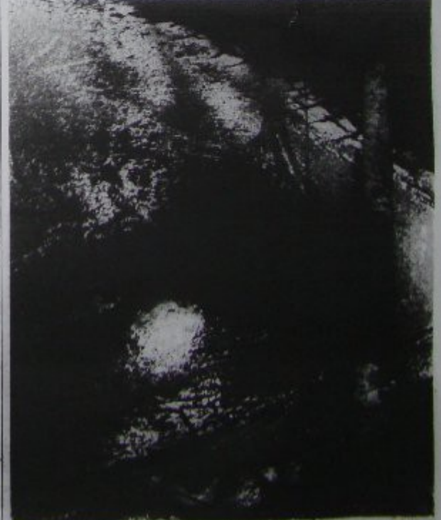
Ein neuer Bohrturm spiegelt sich auf einer Lache fließenden Goldes im Ostgebirge von Nienhagen bei Gell.